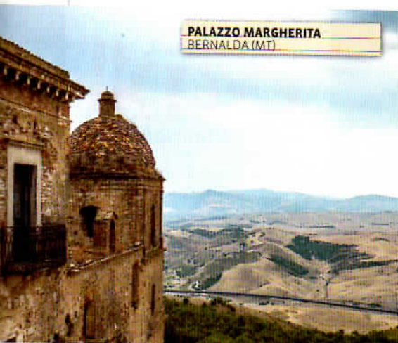
PALAZZO MARGHERITA BERNALDA (MT)