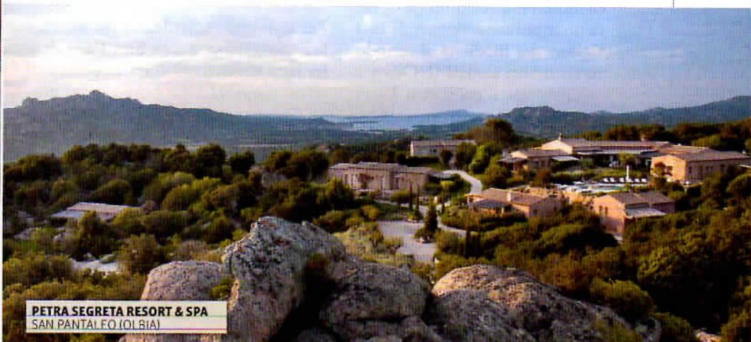
PETRA SEGRETA RESORT & SPA SAN PANTALEO (OLBIA)

Al di fuori dei Sassi, la poco conosciuta Basilicata offre altre meraviglie. Una è Bernalda , nella Magna Grecia, a 50 minuti da Matera e 10 dalle spiagge bianche della costa. Un piccolo borgo balzato da poco agli onori del glam internazionale grazie al regista Francis Ford Coppola , che ha trasformato in relais de charme una dimora nobiliare del XIX secolo: Palazzo Margherita. Sette suite e due garden room in tutto, un salone affrescato che, a richiesta, si trasforma in cinema per proiettare le pellicole della collezione personale di Coppola (300 titoli) e, a tavola, cucina lucana per onorare la me-