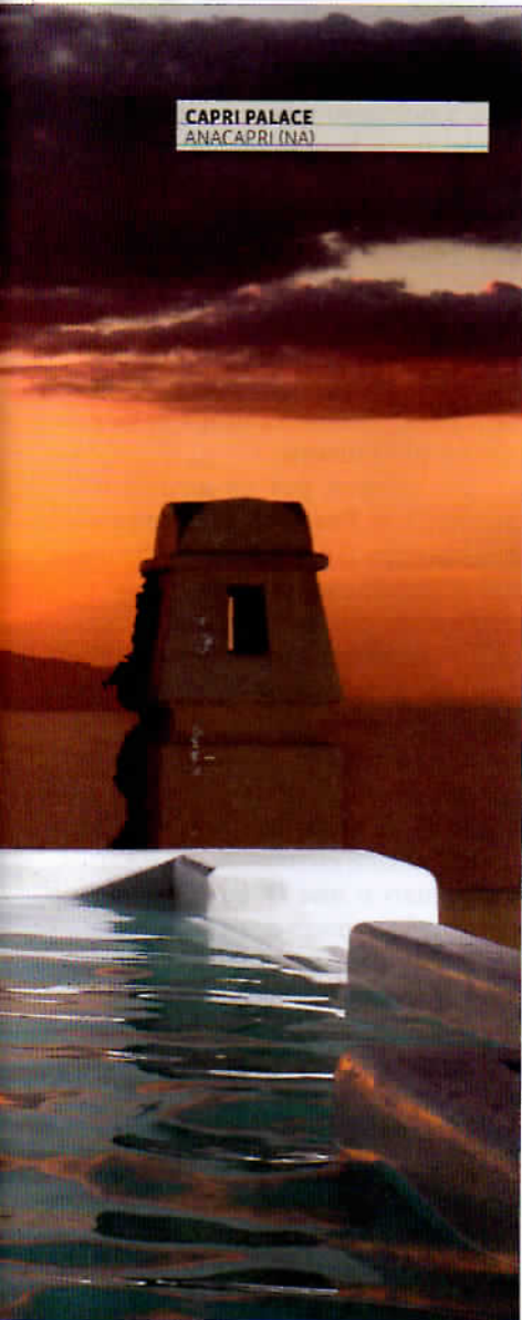
CAPRI PALACE ANACAPRI (NA)

diversa dall'altra, angoli dedicati alla lettura e alla conversazione, sala biliardo, salotti (anche en plein air) e piscina riscaldata. L'Olmo è, innanzitutto, un luogo dell'anima. Dove i pasti sono serviti all'ora e nel posto preferito e vengono organizzati safari fotografici, escursioni culturali e itinerari a cavallo o in bicicletta, alla scoperta di un paesaggio immortalato da grandi pittori del Rinascimento. A 7 km da Pienza, gioiello rinascimentale creato da Pio II; a 11 da Bagno Vignoni, con la straordinaria piazza delle Sorgenti dove una grande vasca romana raccoglie le acque delle sorgenti termali i cui vapori trasformano il centro del borgo in un luogo dalla bellezza cinematografica e a 30 da Montalcino. Camere da 297 a 429 euro. L'Olmo, Monticchiello (Si) tel. 0578755139, www.olfmopienza.it