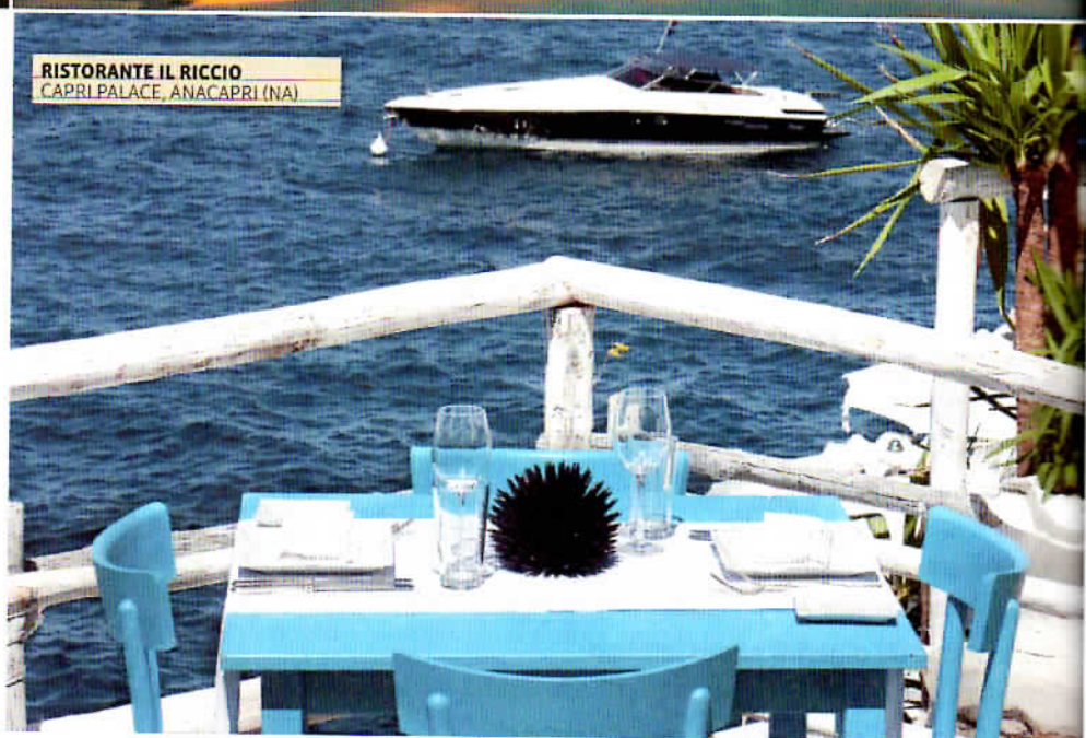
RISTORANTE IL RICCIO CAPRI PALACE, ANACAPRI (NA)

S EDICI MILIONI DI ITALIANI ai blocchi di partenza per i ponti di primavera, un lungo city break o un assaggio di vacanza dal sapore già quasi estivo. Tanto più che la Pasqua alta e le festività del 25 aprile-1° maggio regalano la possibilità di trasformare i ponti in vere vacanze, con tutto il tempo, volendo e potendo per prendere un aereo e volare anche lontano. Da Pasqua al 25 aprile, per esempio, con 5 giorni lavorativi se ne fanno 12 di ferie, mentre ne bastano 4, dal 22 aprile al 1° maggio, per una vacanza di 10 giorni. Ma pure la festività del 2 giugno, che cade di venerdì, regala il primo long week end d'estate anche senza aggiunte strategiche. Mega o mini, i ponti primaverili rappresentano un'industria fiorente e in crescita (+6% la stima per il 2017), con un introito